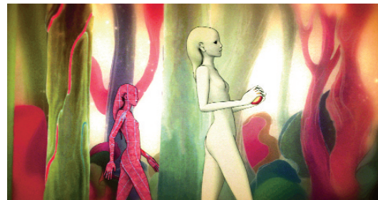
Trembled Blossom e, sopra, il lookbook-movie della p/e 2011. Entrambi per Prada.